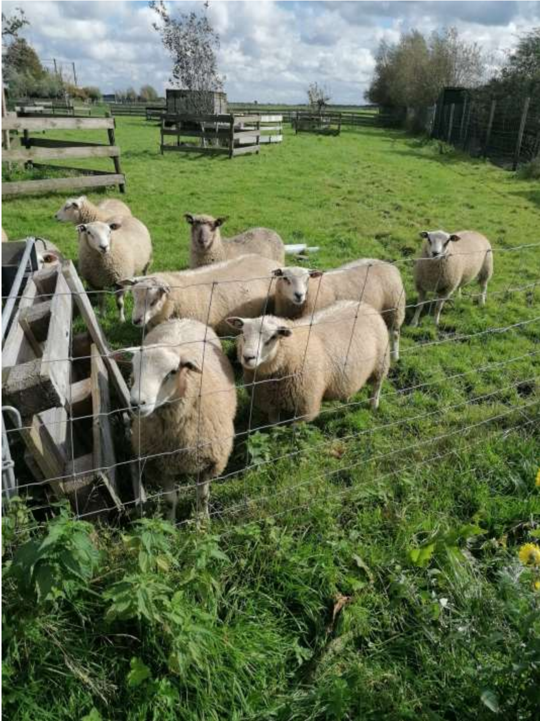
De schapen staan in de boomgaard.