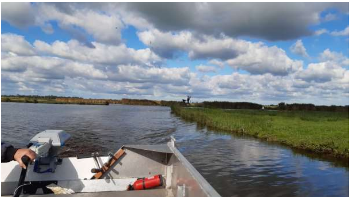
Een stuk meer wolken maar ook erg mooi!