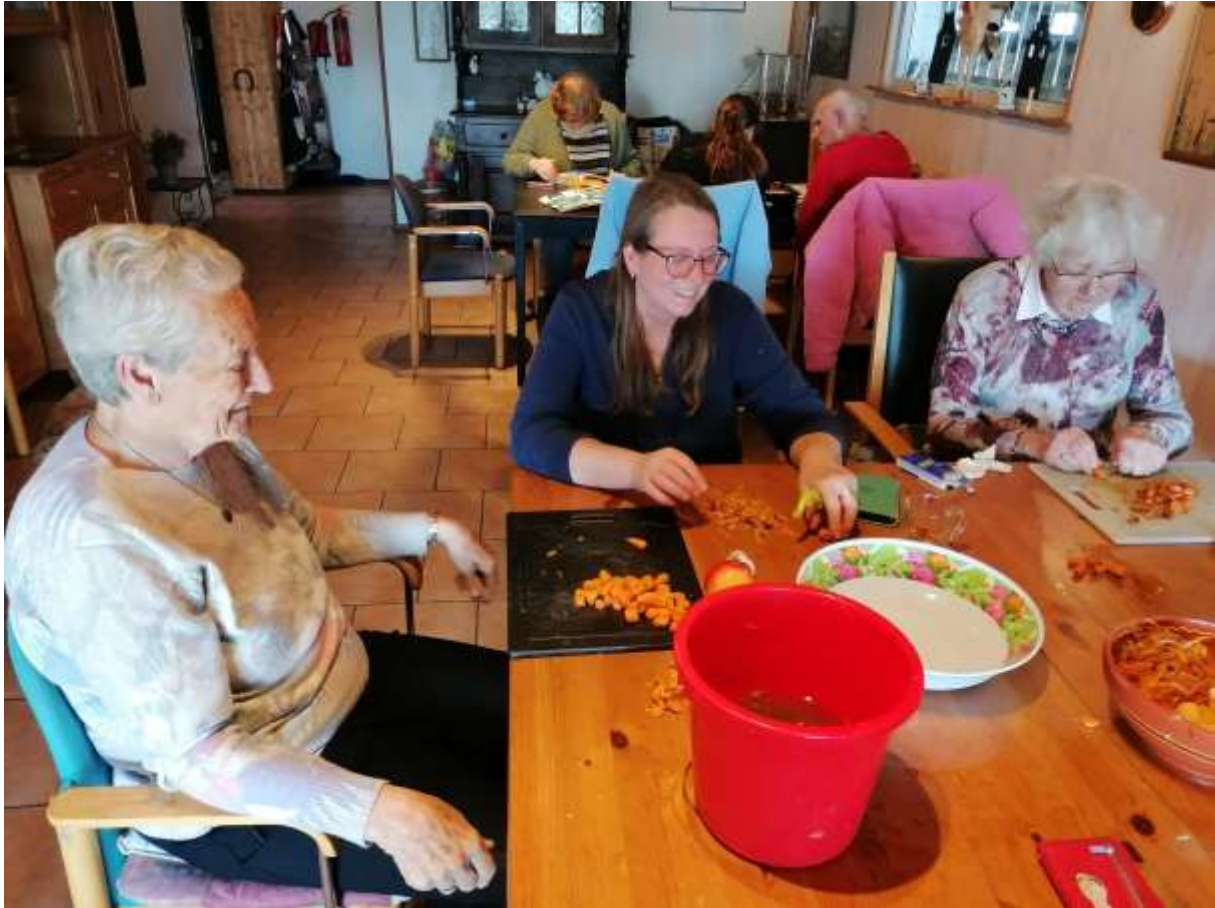
Er wordt wat afgekookt de laatste tijd zeg, super leuk!