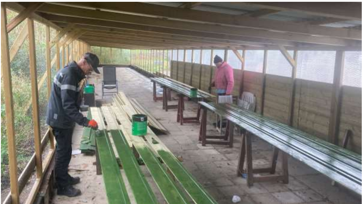
Buiten regent het, maar in de kippen ren kan toch geschilderd worden!