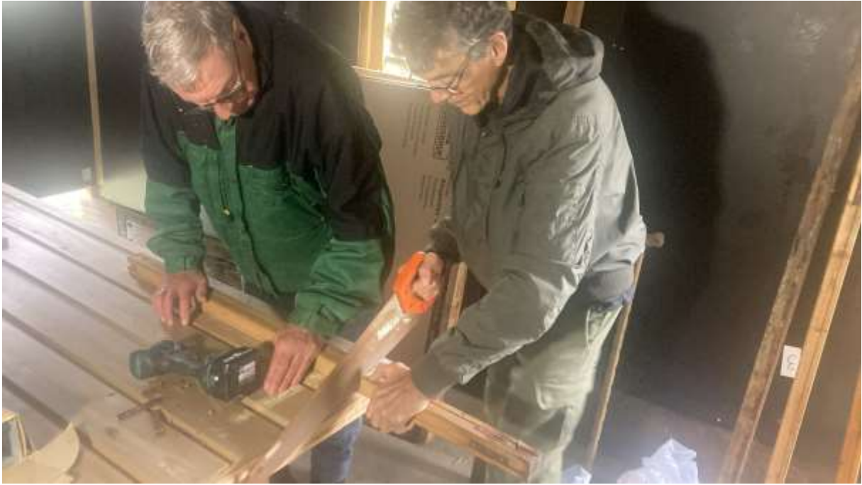
Team work in het kippenhok.