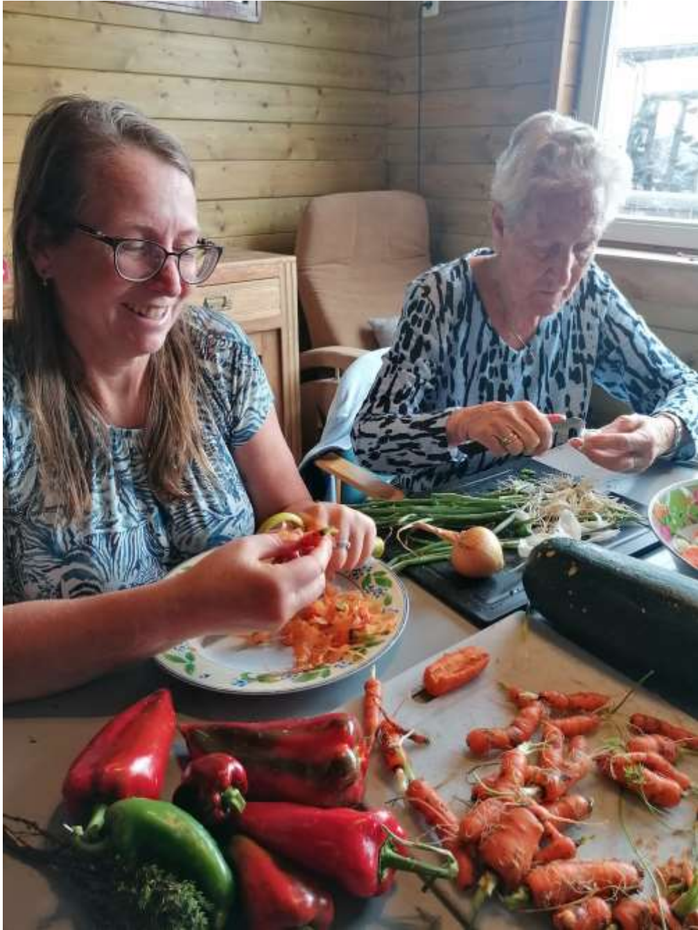
Rechts, midden op de foto ligt een courgette waar je “u” tegen zegt. Die groeit een stuk harder dan de worteltjes! Haha