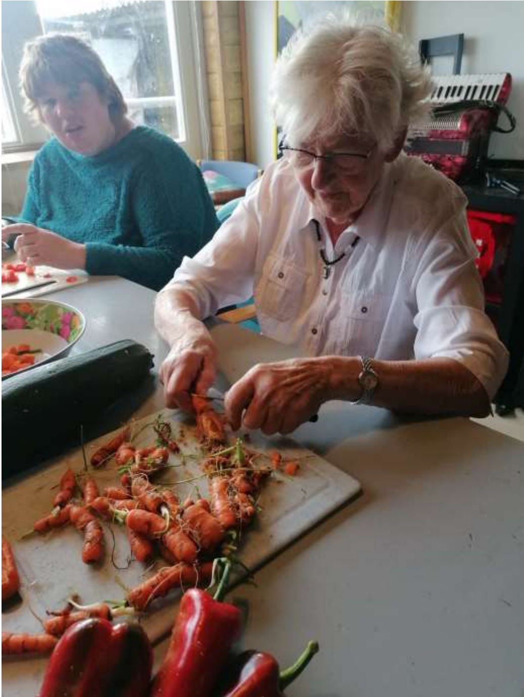
Wat een lieve worteltjes!