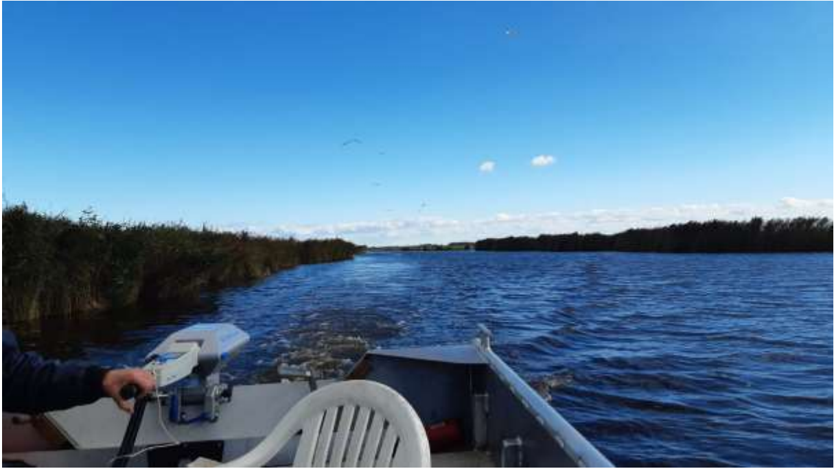
Een mooie vaar foto. Riet, wolkjes, vogelt, kabbelend water..