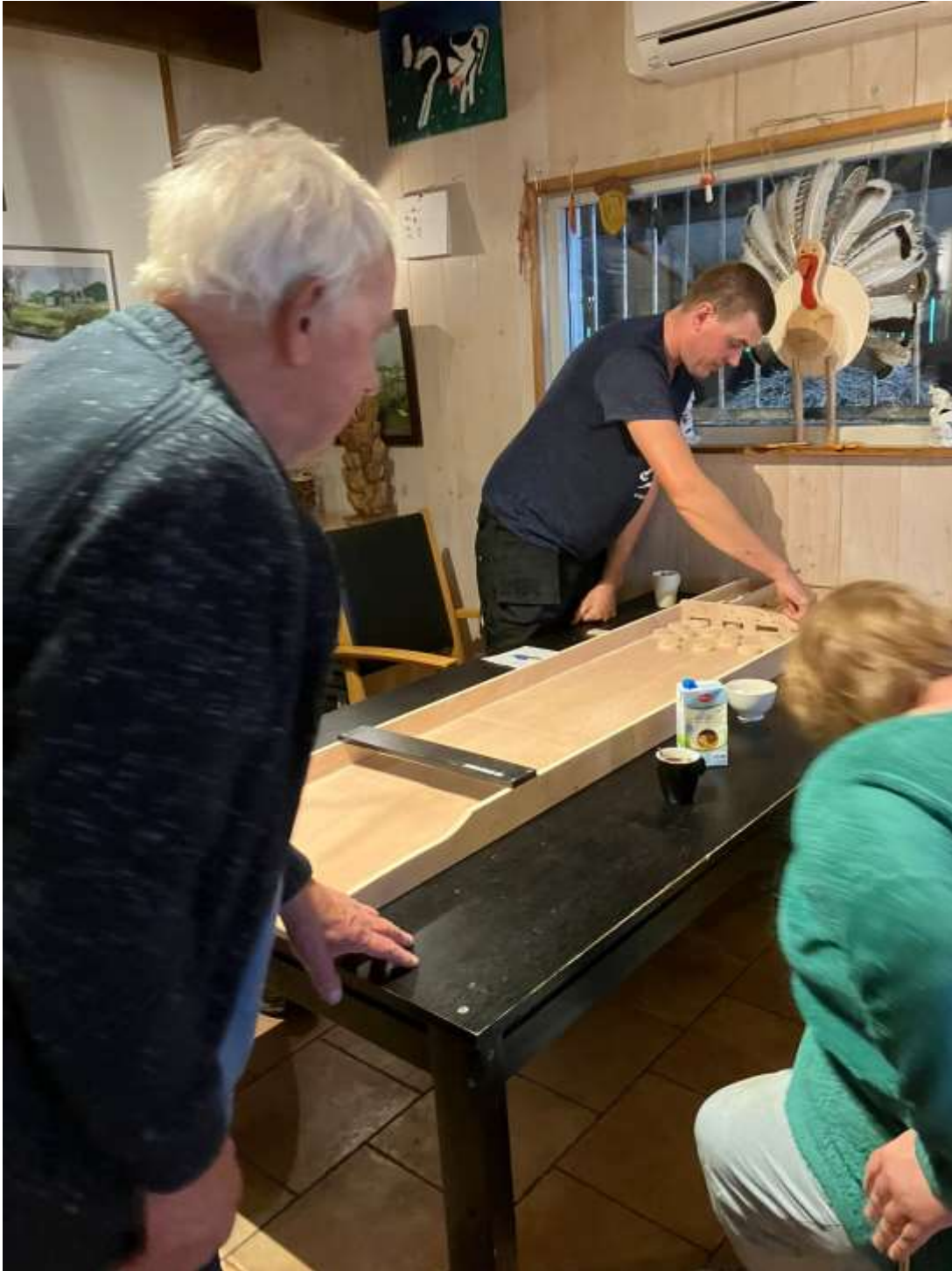
Een gezellig potje sjoelen terwijl het buiten regent.