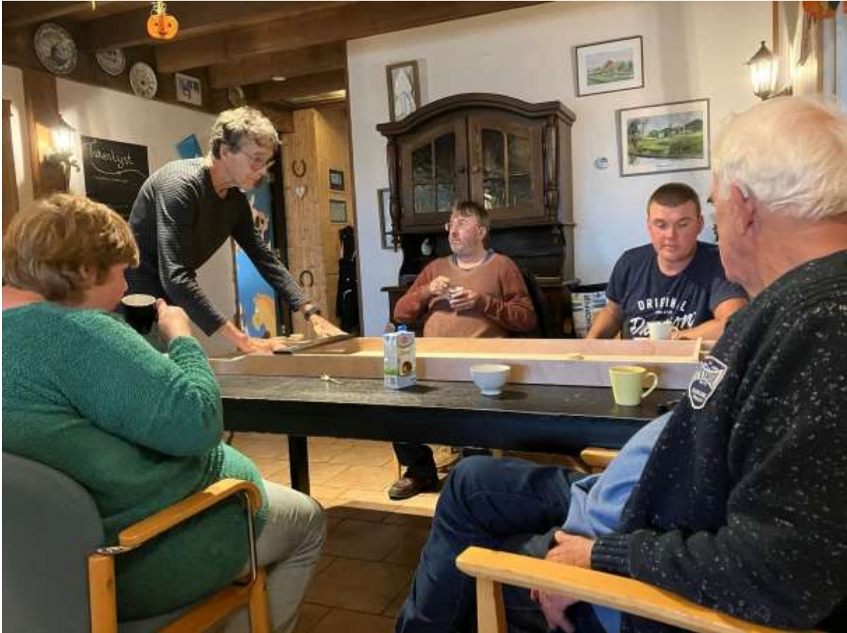
Ron in actie.