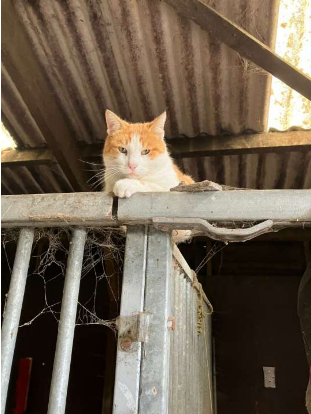
Hier ligt Sipke bovenop het hek van een paardenbox. Lijkt me dat zachte bedje van net toch fijner liggen hoor haha