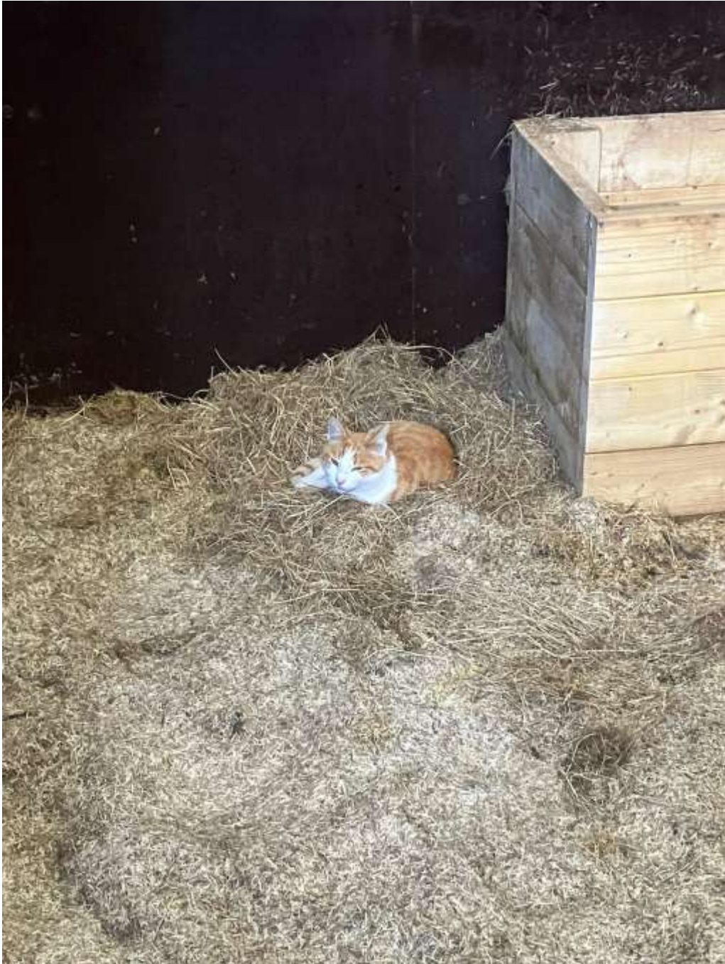
Poes is in een paardenbox gekropen, wat een lekker zacht plekje zo.