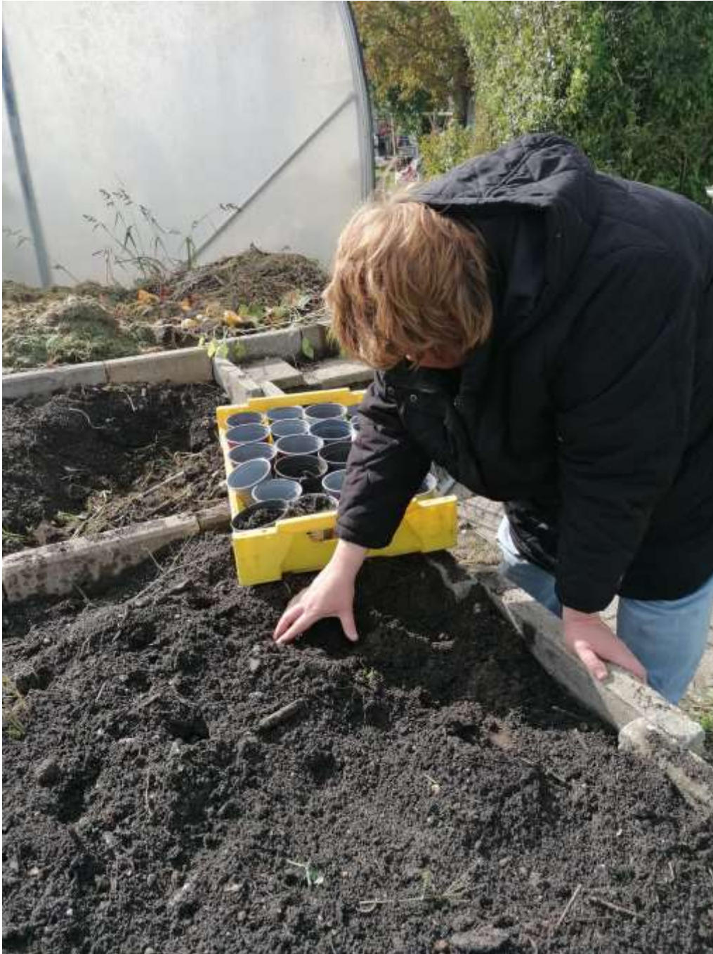
Potjes vullen met potgrond.