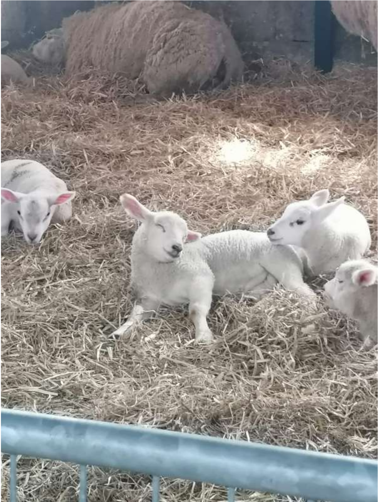
Even lekker rustig zo samen in het stro.