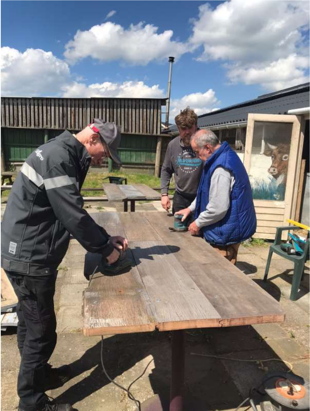
De tafels moesten nog even worden geschuurd.