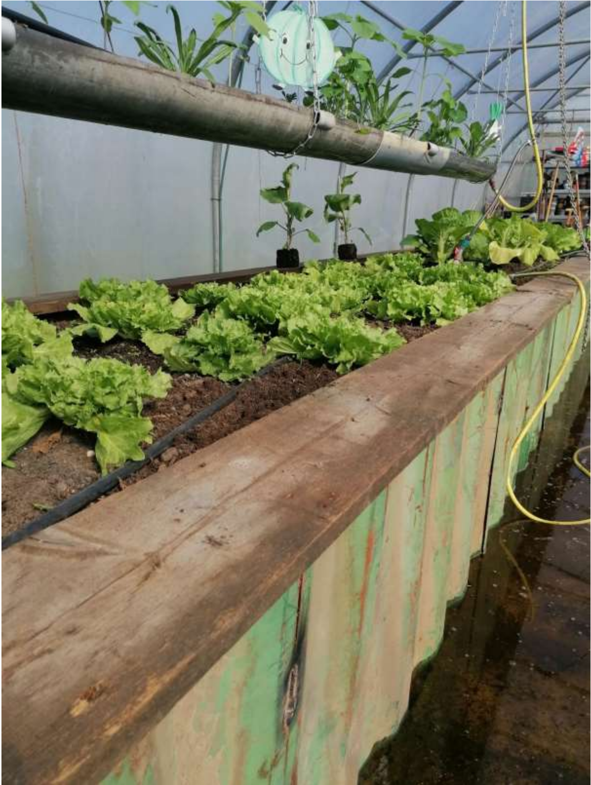
Een mooi plaatje van de kas. Hier op de voorgrond de andijvie. Vandaag is er al een heleboel groente naar de voedselbank gebracht en toevallig kregen we ook alweer nieuwe plantjes!