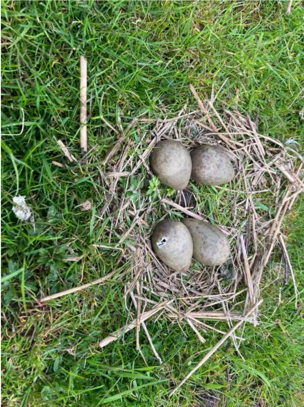
Een mooi nestje in het land! Helaas kan ik jullie niet vertellen van wie deze eieren zijn.