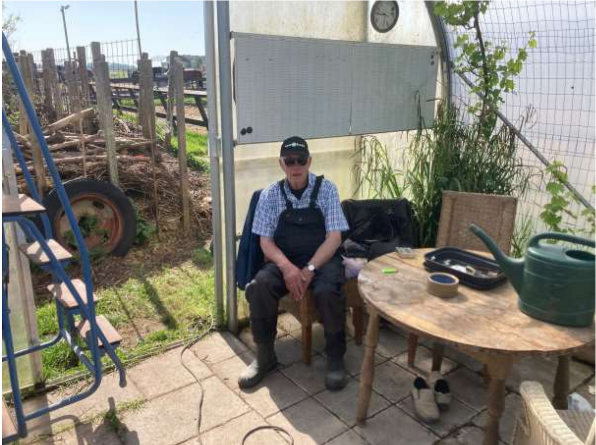
Het was heerlijk warm in de kas met het zonnetje!