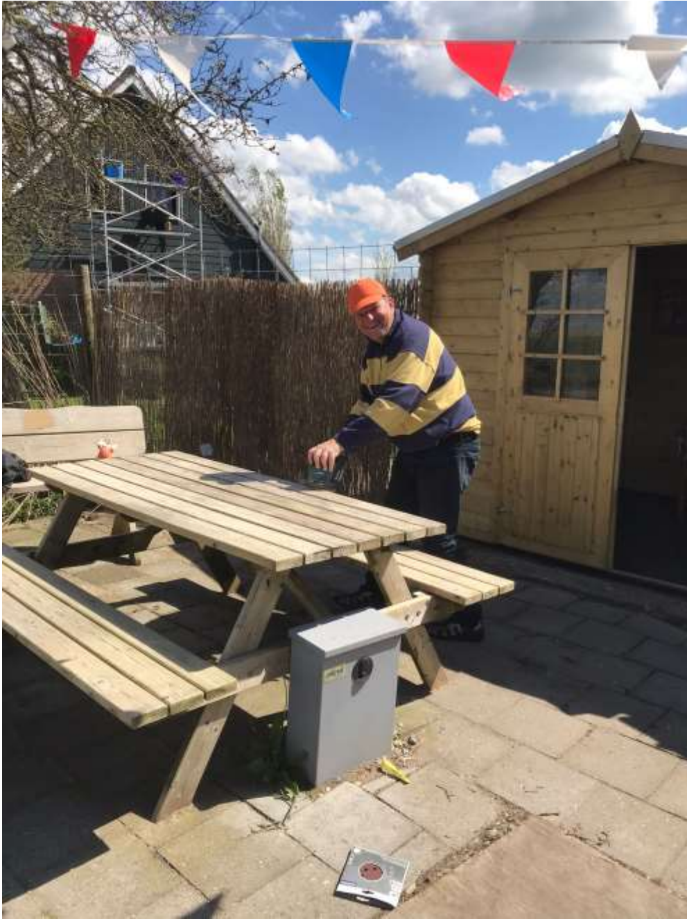
Ook de picknicktafel kon wel een schuur-beurtje gebruiken!