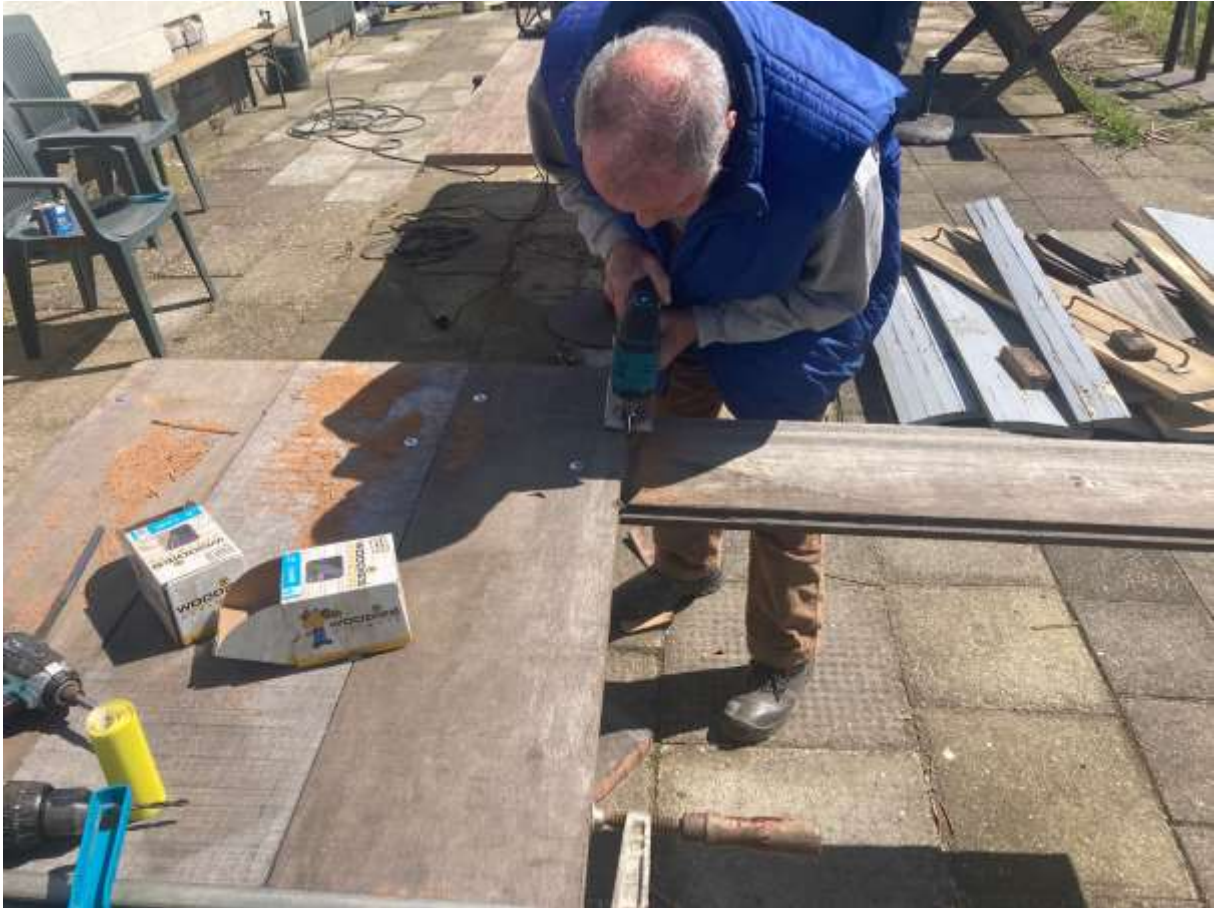
Er werd weer een nieuwe tuintafel gemaakt.