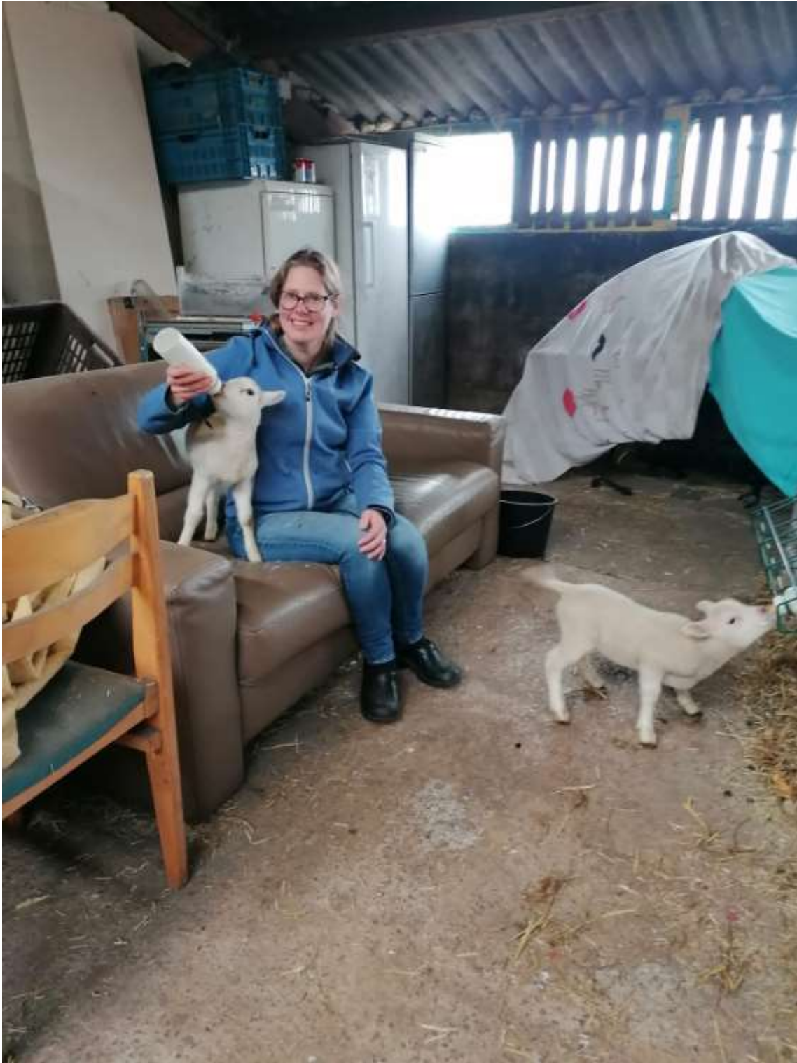
Een lammetje drinkt al zelf een hele fles leeg, de ander vergeet nog wel eens door te drinken dus die krijgt nog wat hulp.