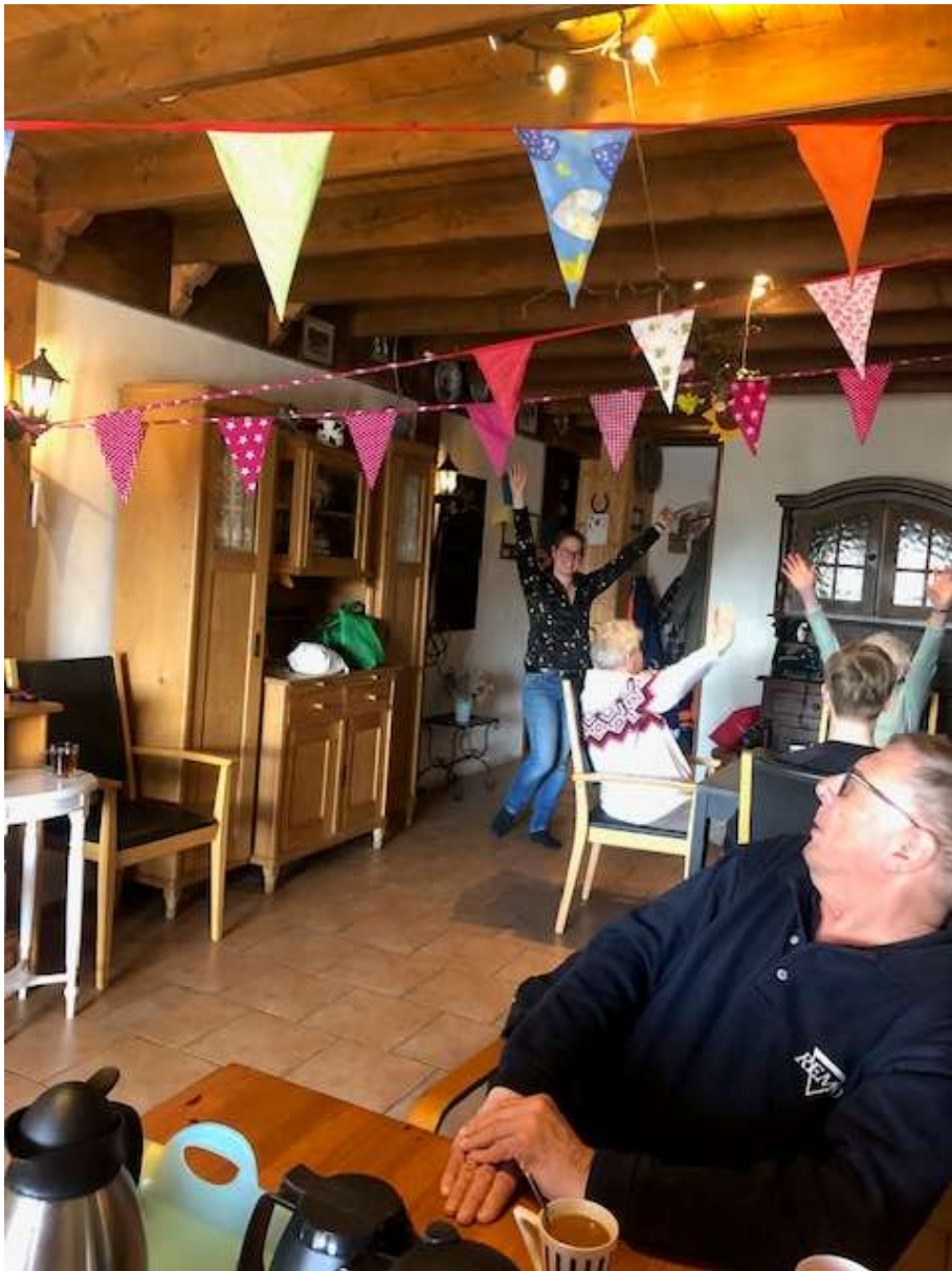
En zo af en toe vieren we hier een feestje! Ik was jarig, hoera!