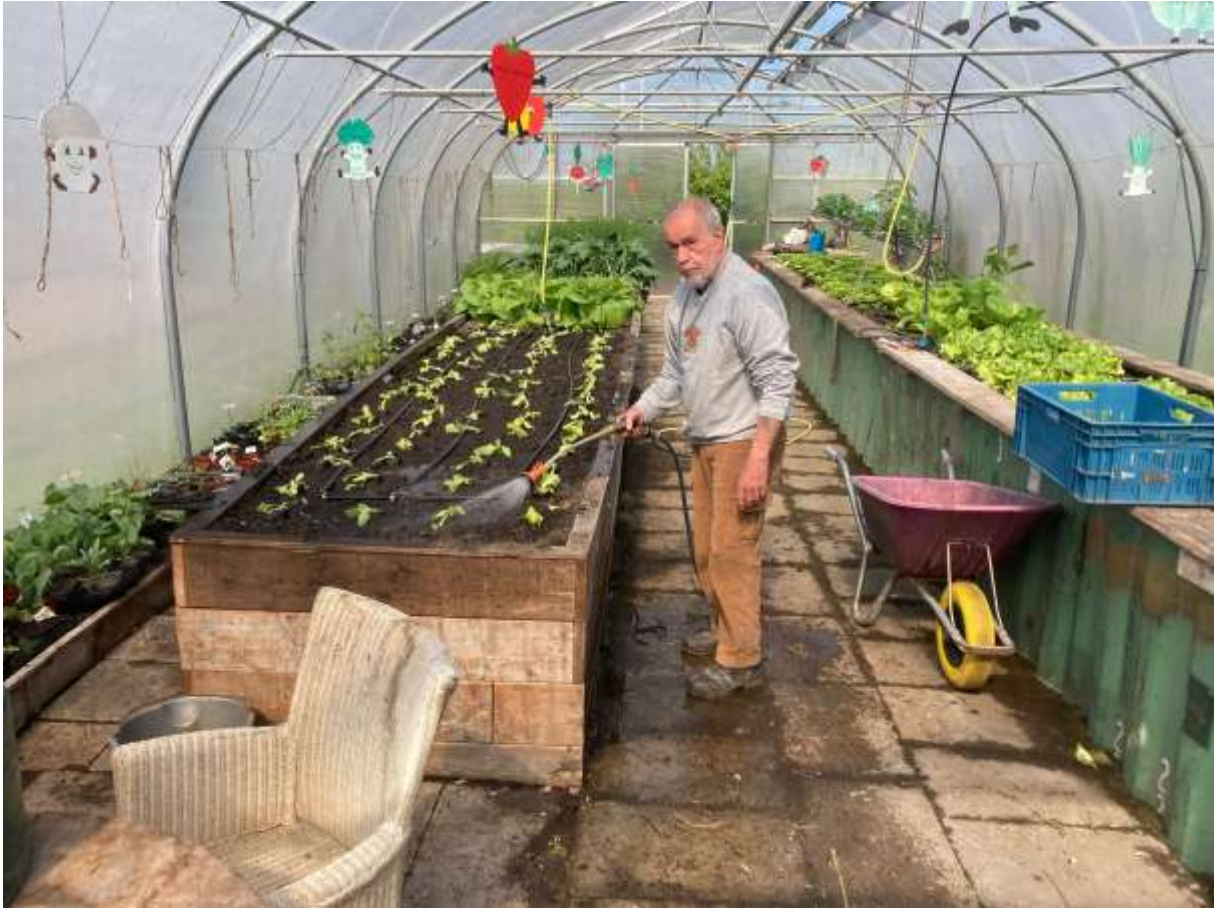
De nieuwe plantjes zijn geplant en hebben water.