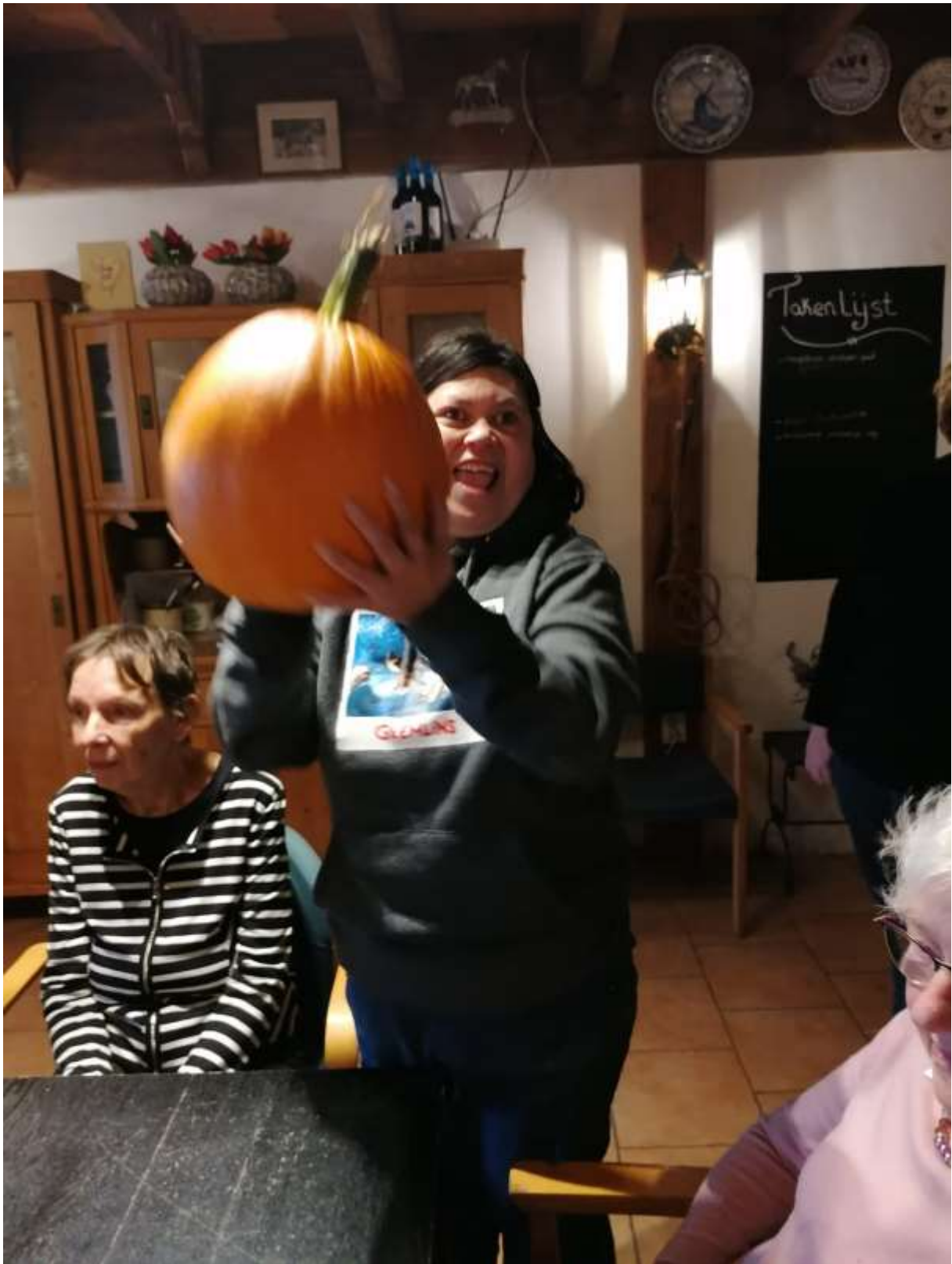
Kijk eens wat een spierballen.