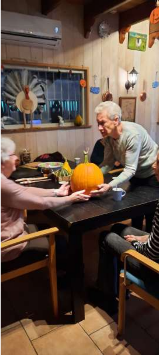
Ook even proberen.