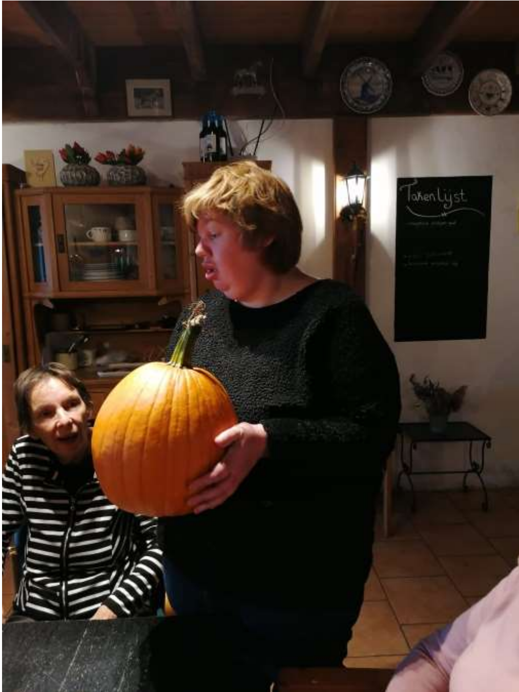
Moeilijk hoor, schatten hoeveel iets weegt.