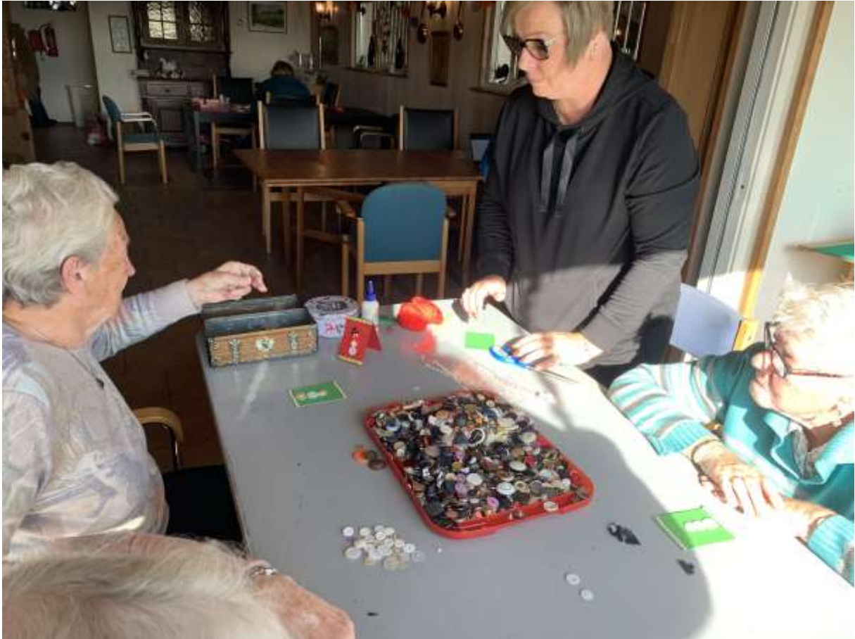
Daar kwamen een hoop knopen bij kijken.