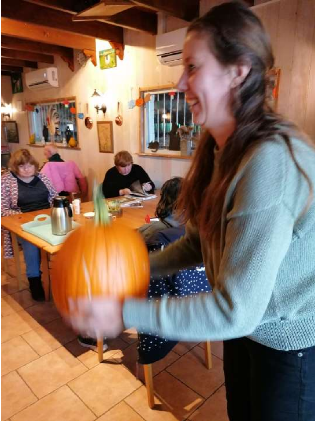
Het lijkt wel of ze er mee gaat gooien! (ik hoop het niet)