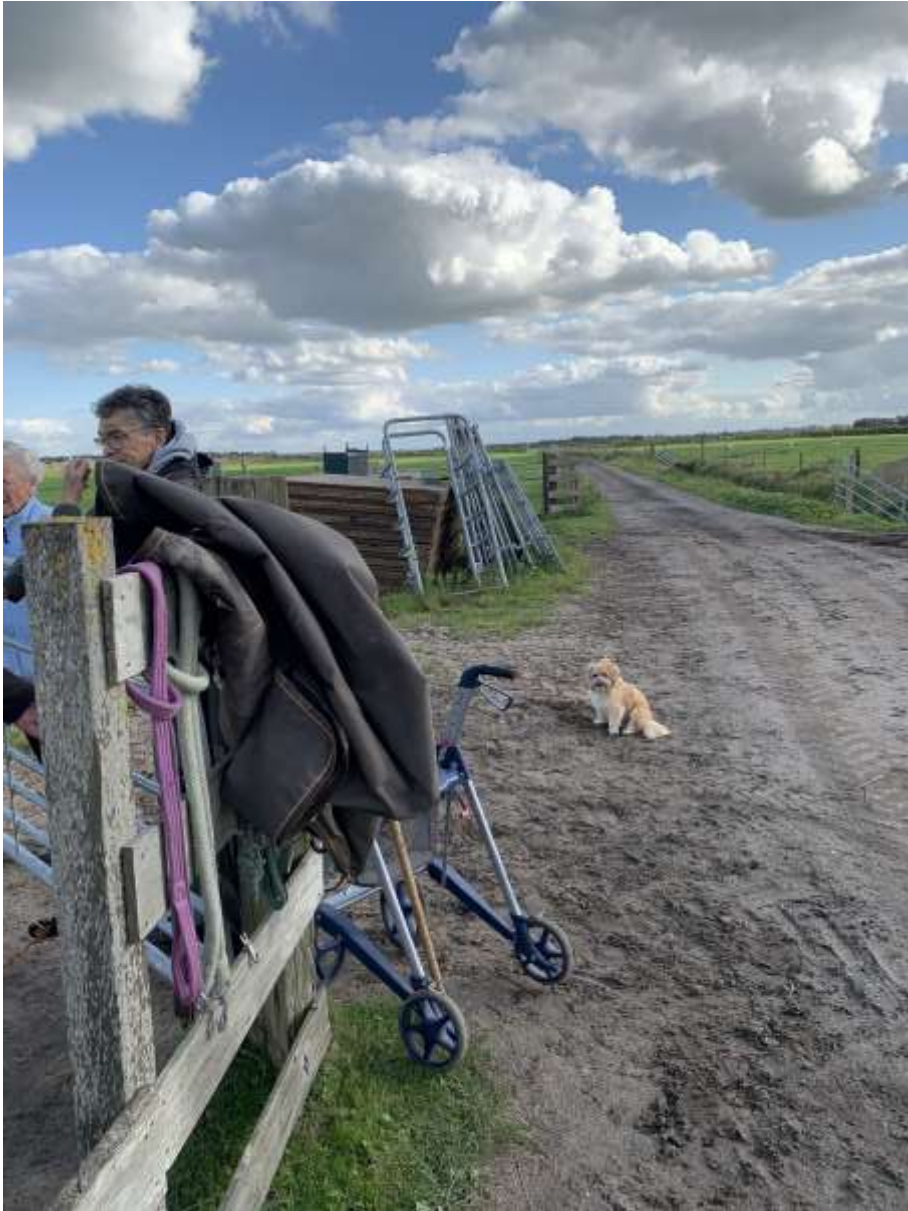
En zoals altijd is Bram in de buurt van Rona.