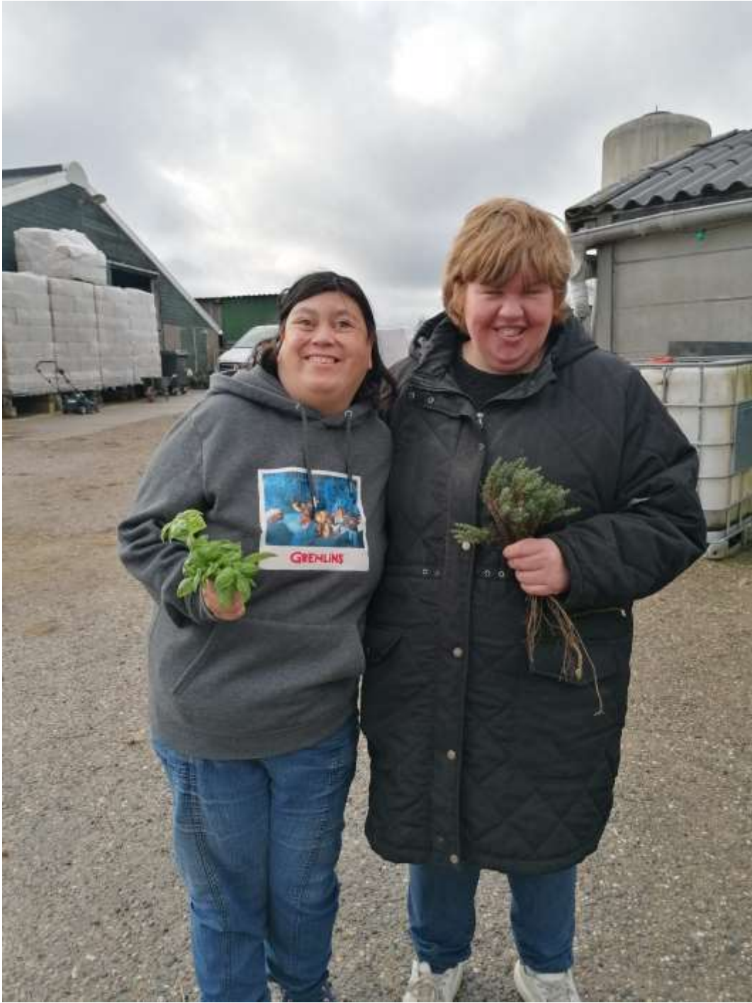
Kruiden halen voor in de soep.