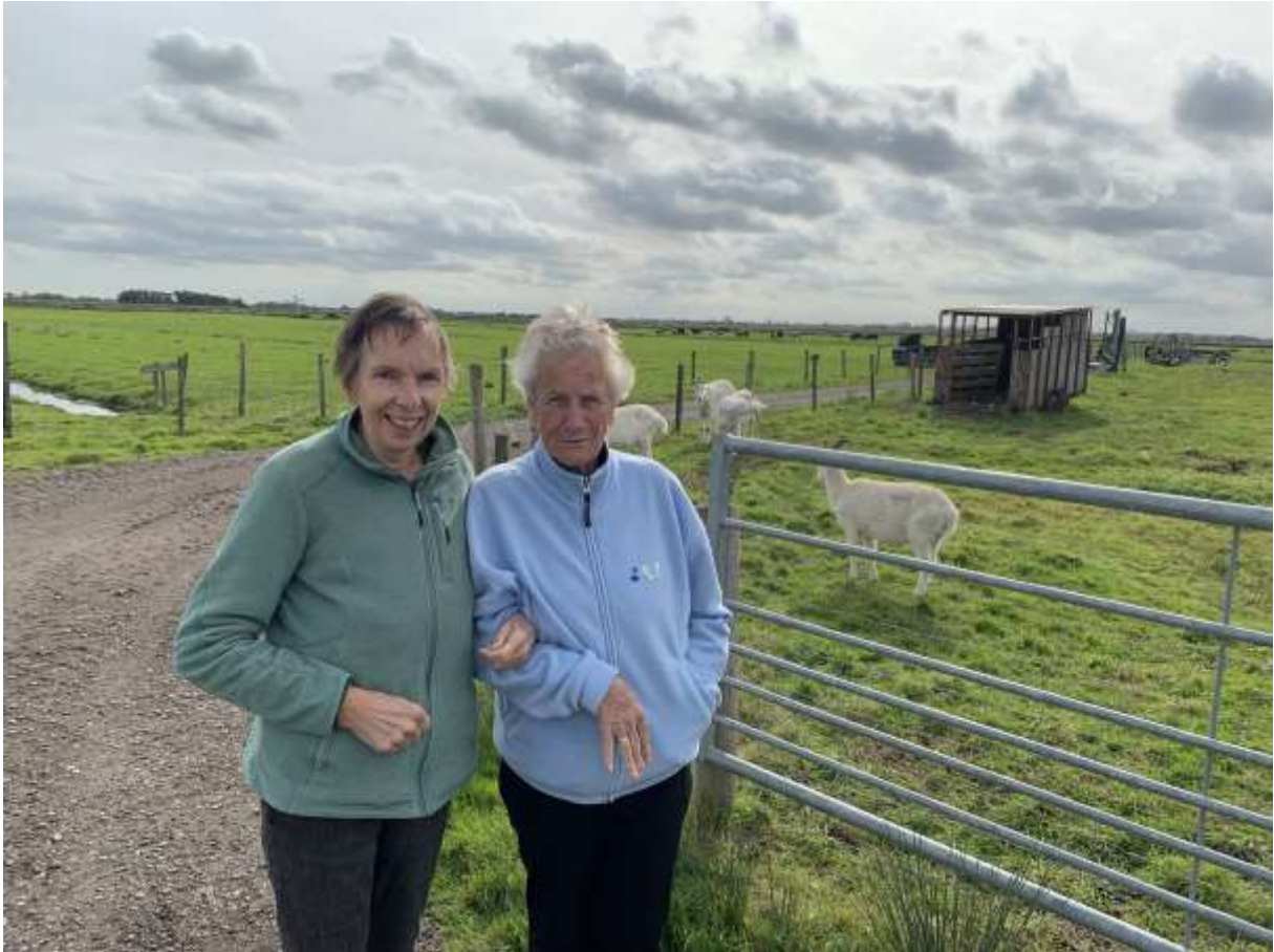
De dames waren lekker bezig want zelfs even bij de geiten gekeken.