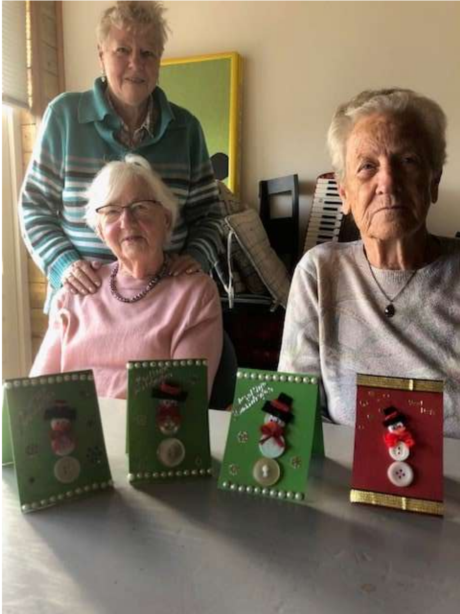
Tadaa! Leuke kaartjes met sneeuwpopjes.