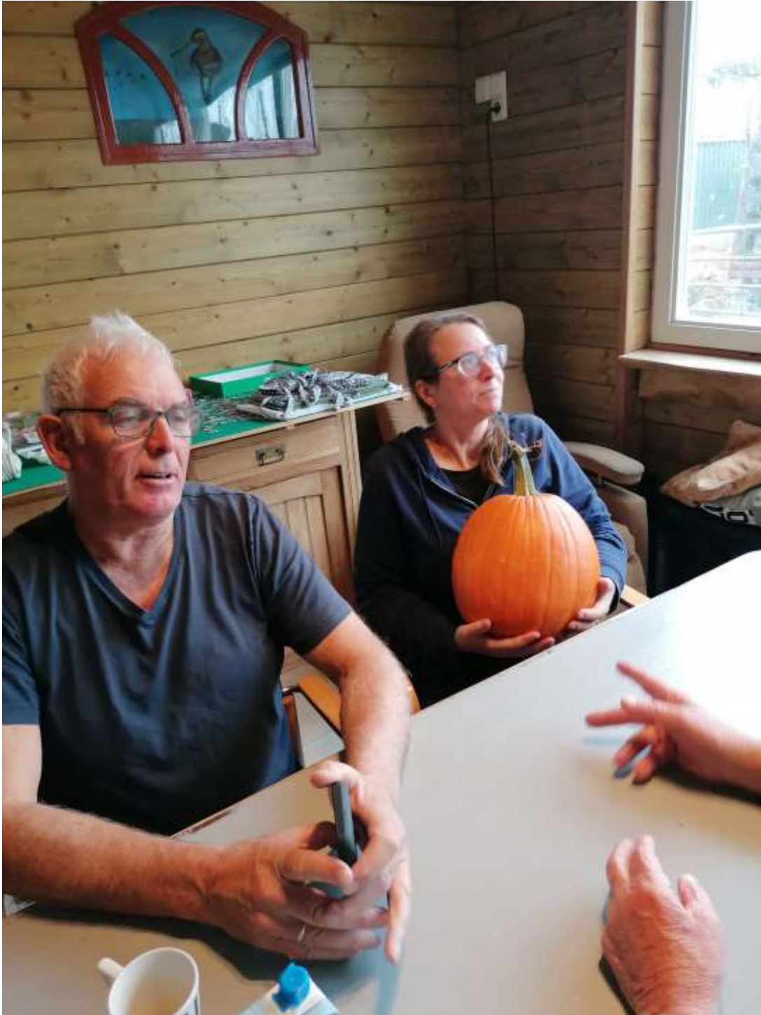
Ziet er ontspannen uit, met zo'n pompoen op schoot.