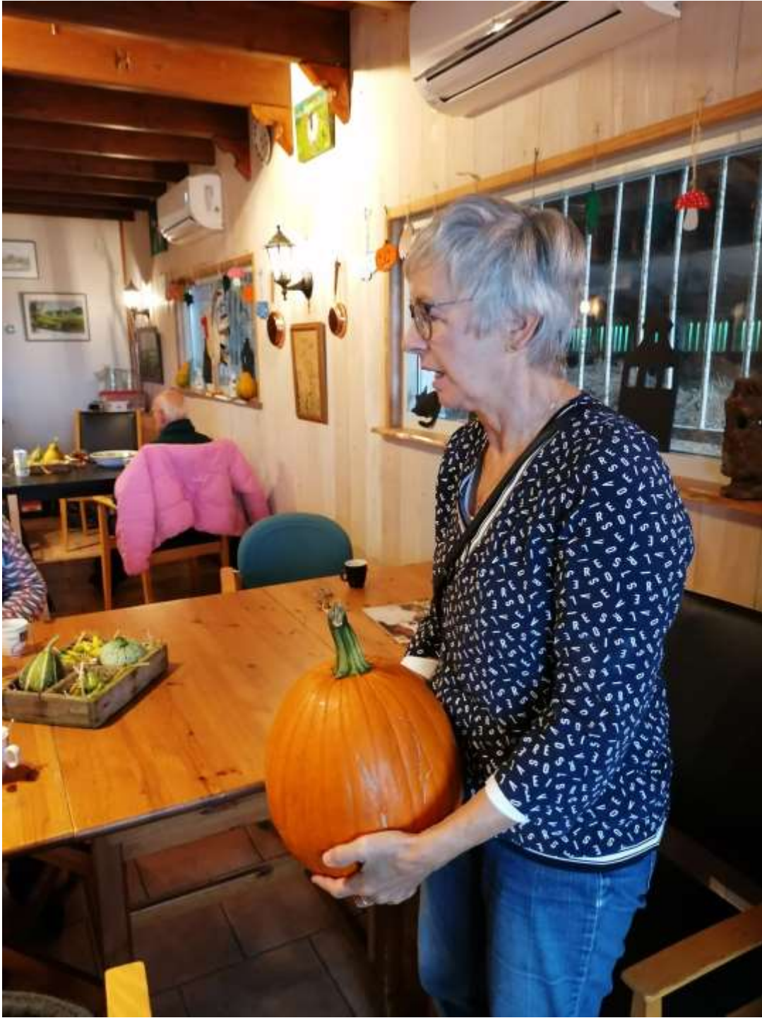
Wat zou hij wegen?