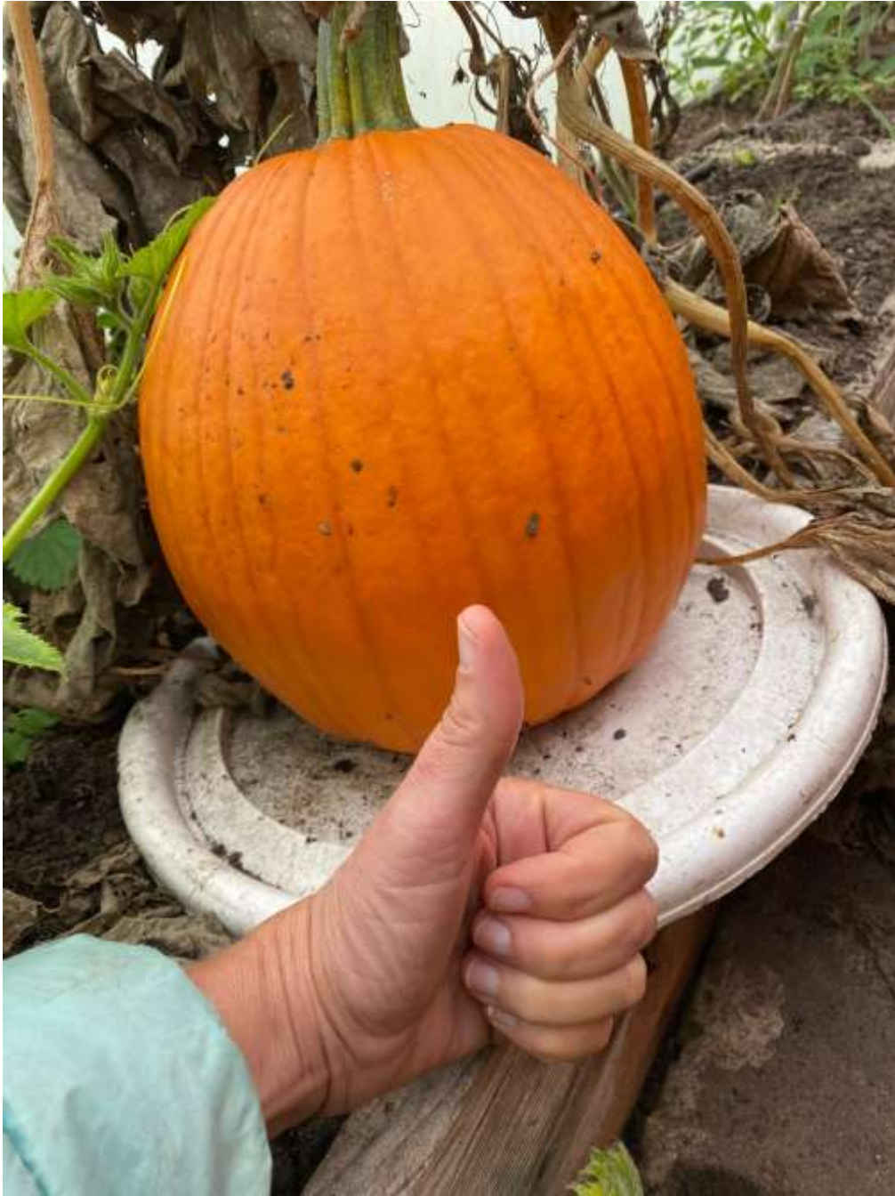
In de kas groeide nog een mega pompoen!