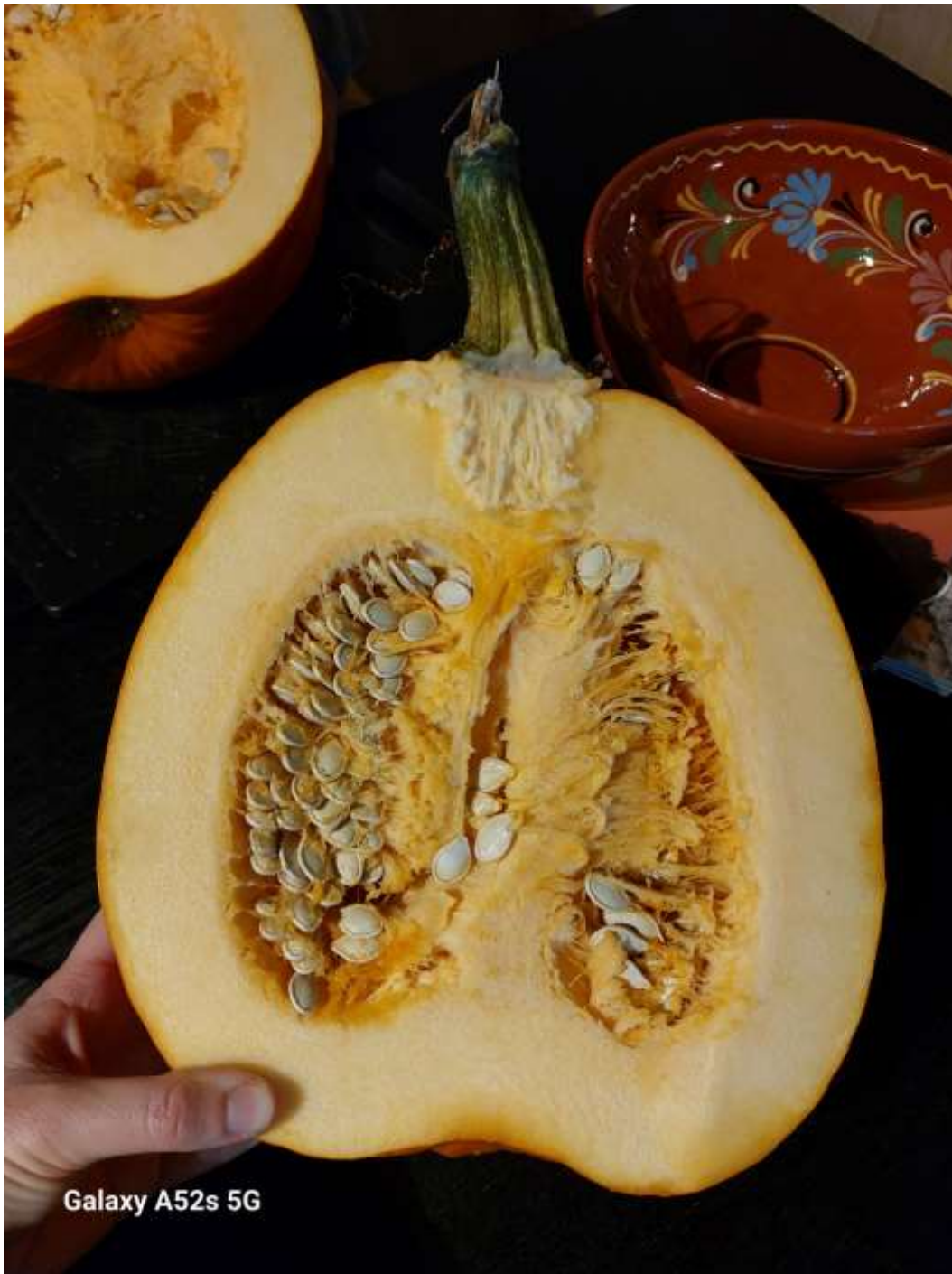
Mooi he, zo de dwarsdoorsnede.